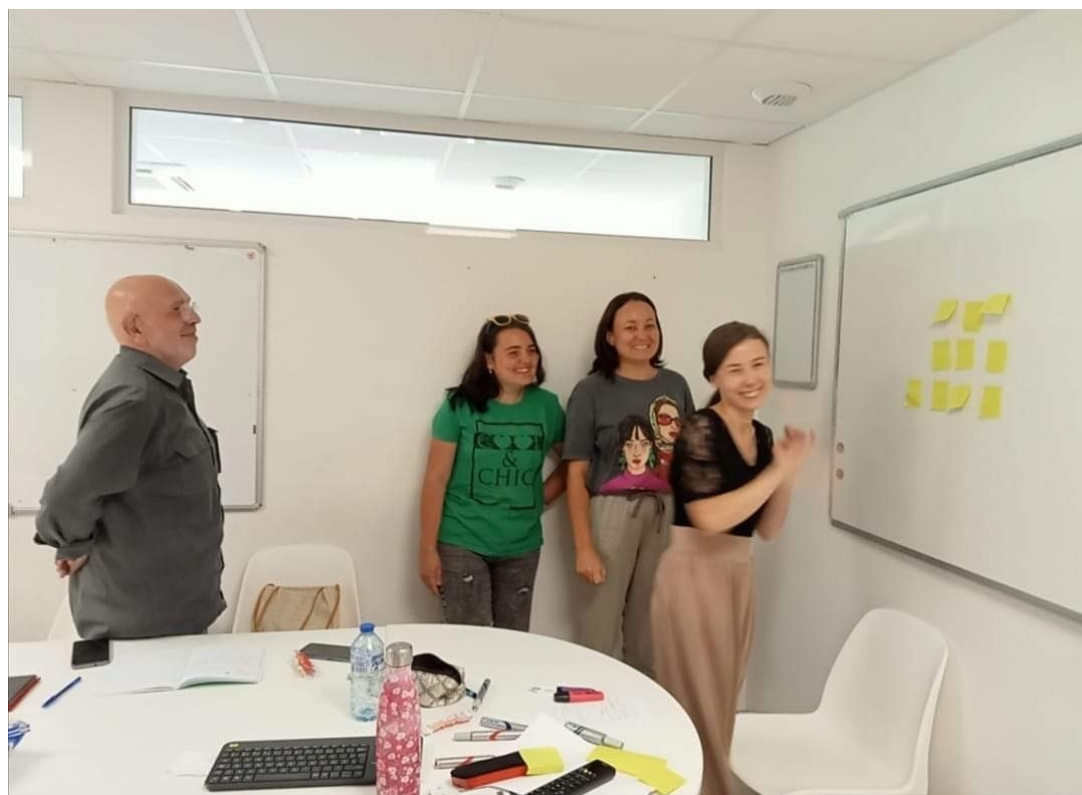
Cours Formation pour Formateurs, Institut Linguistique Adenet, Montpellier