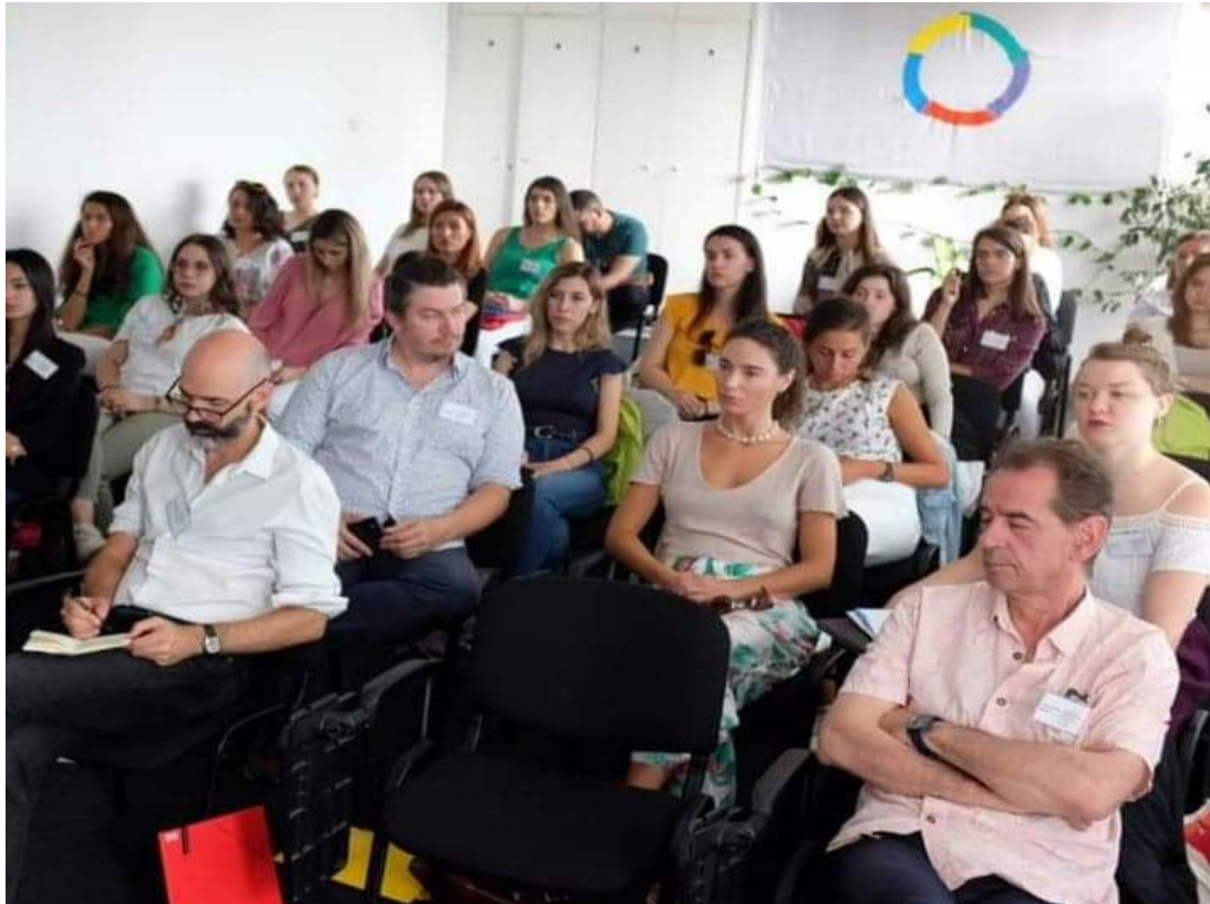
L'ouverture du Forum - formateurs et participants