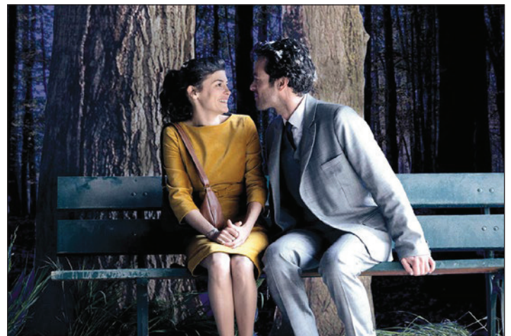
▲ Extrait du film de Michel Gondry, L'Écume des jours , avec Audrey Tautou et Romain Duris.