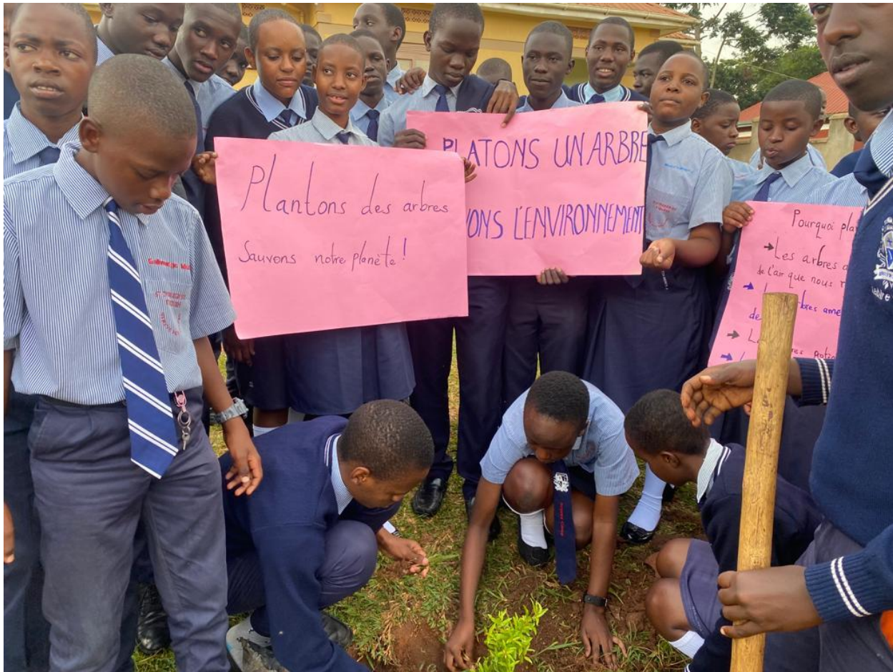
Les élèves avec des messages relatifs au projet INR réalisé par l' APFO lors de la plantation d'un arbre.