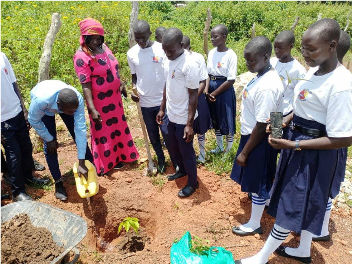
Le professeur et les apprenants de Millenium College, Koboko en plantant des arbres