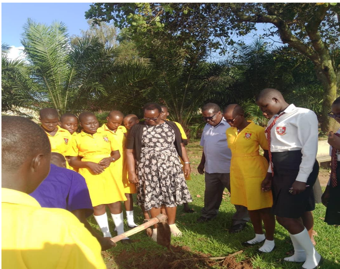
Le directeurs et les apprenants de St. John Pope Paul II College, Gulu lors de la plantation des arbres