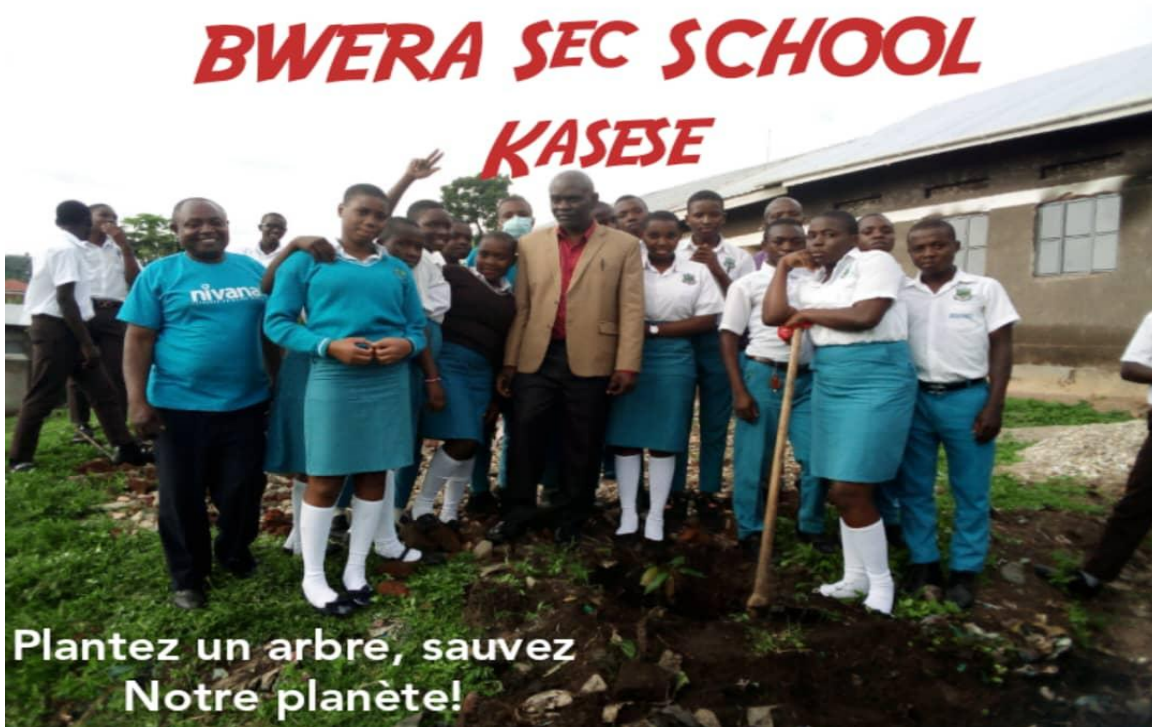
Le professeur de français et les apprenants de Bwera Secondary School Kasese lors de la plantation des arbres