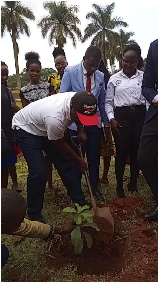
Le Recteur de Makerere University Business School, les membres du comité exécutif de l'APFO, les professeurs et les étudiants lors de la plantation des arbres à Makerere University Business School