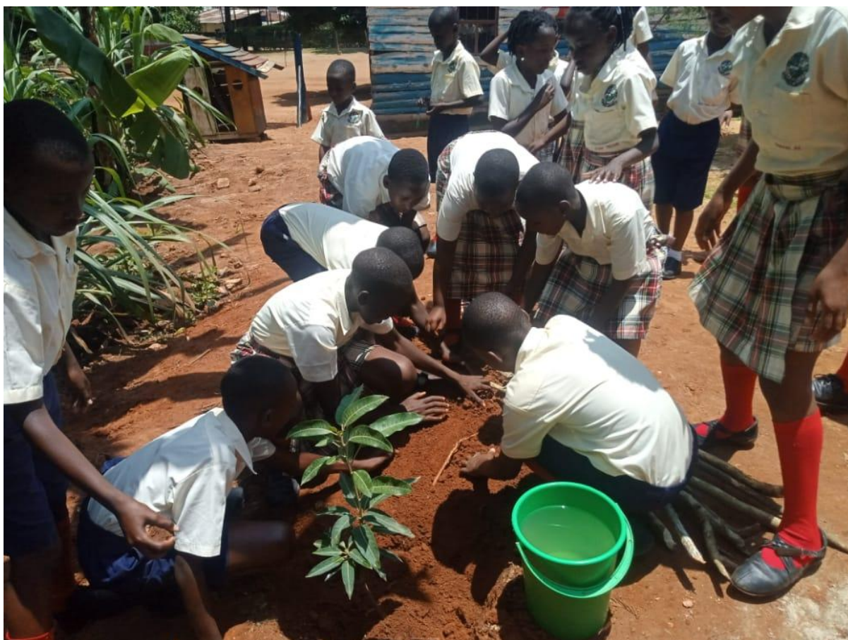
Les écoliers de Mbarara City Primary School en plantant leur arbre