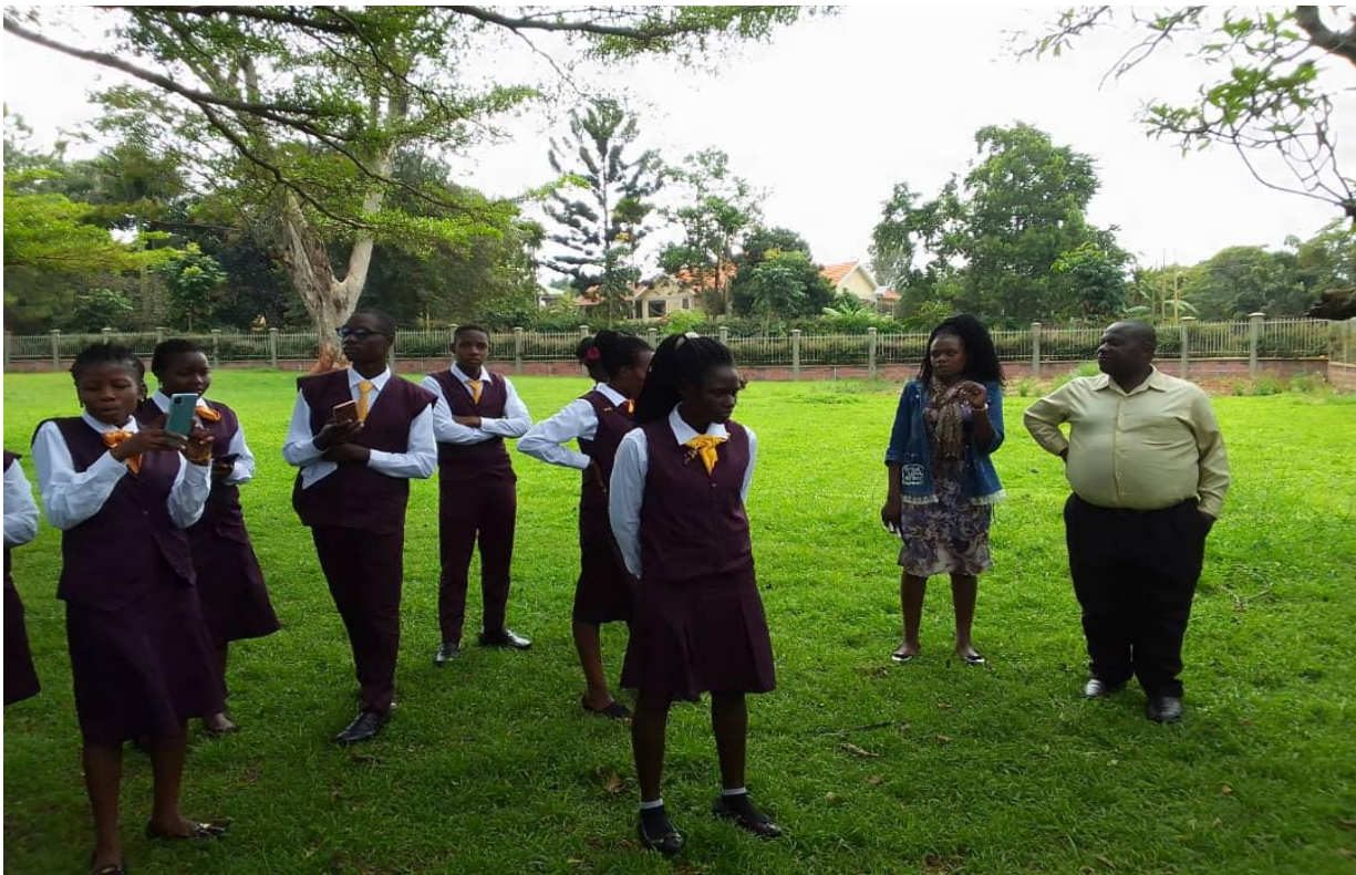
Les professeurs de français ( à droite) et les étudiants de Jinja Vocational and Hotel Management Institute lors de la plantation des arbres