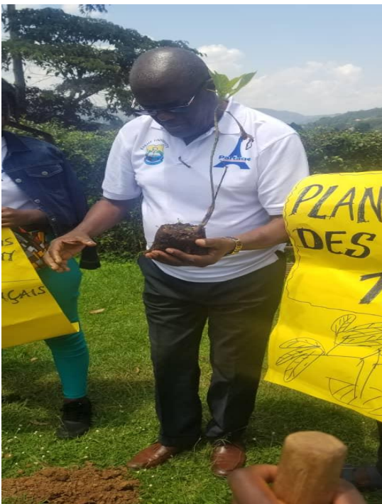
Un professeur de Kabale University lors de la plantation des arbres