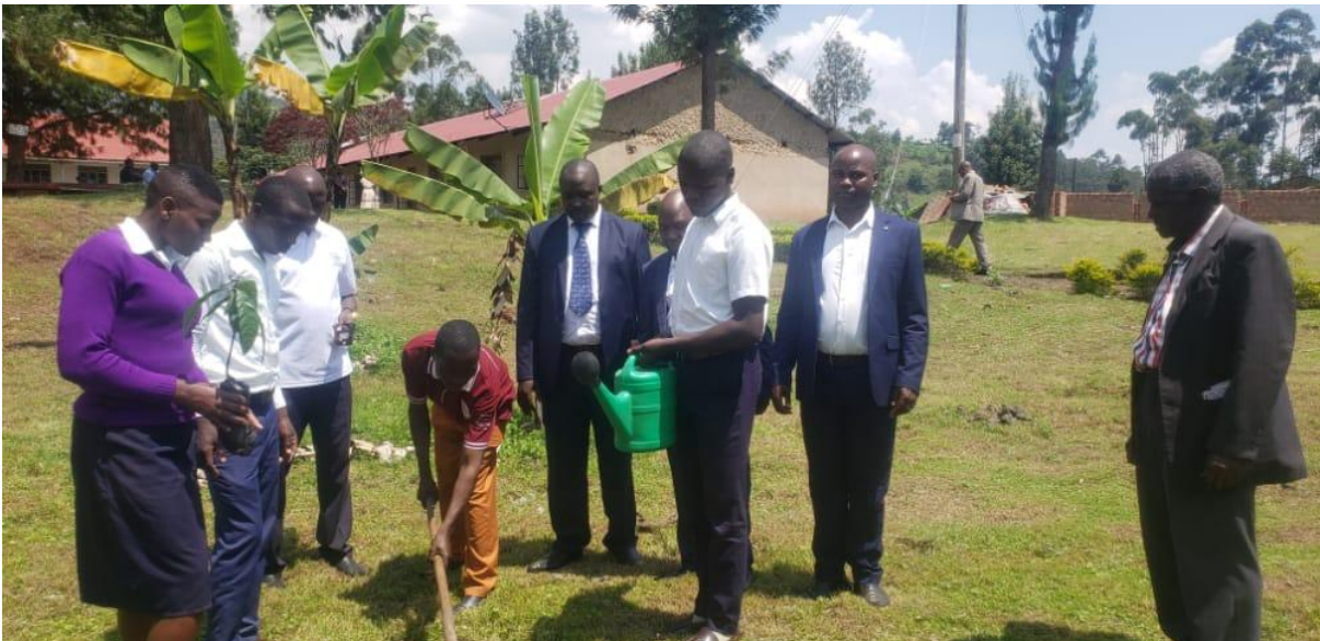
Les directeurs, les professeurs de français et les apprenants de Kabami Secondary School lors de la plantation de leur arbre