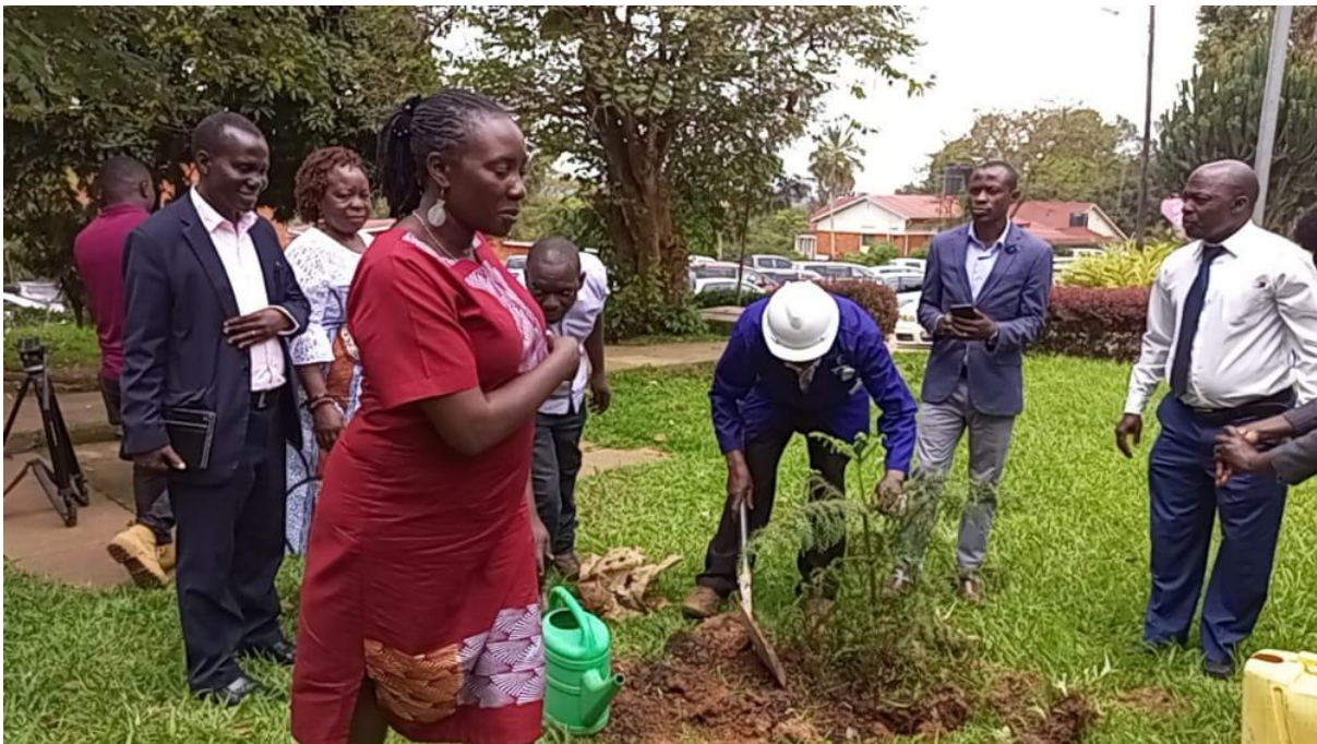
La Présidente de l' APFO avec Le Chef de Département des Langues Européennes et Orientales lors de la plantation d'un arbre dans le cadre du projet à l' Université de Makerere en présence des médias locaux.

Voici ci-dessous quelques photos prises dans le cadre du projet INR 2022 dans des établissements scolaires différents en Ouganda pendant la plantation des arbres ;